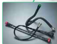
二層ストレートチューブ