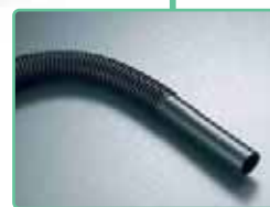
二層コルゲートチューブ